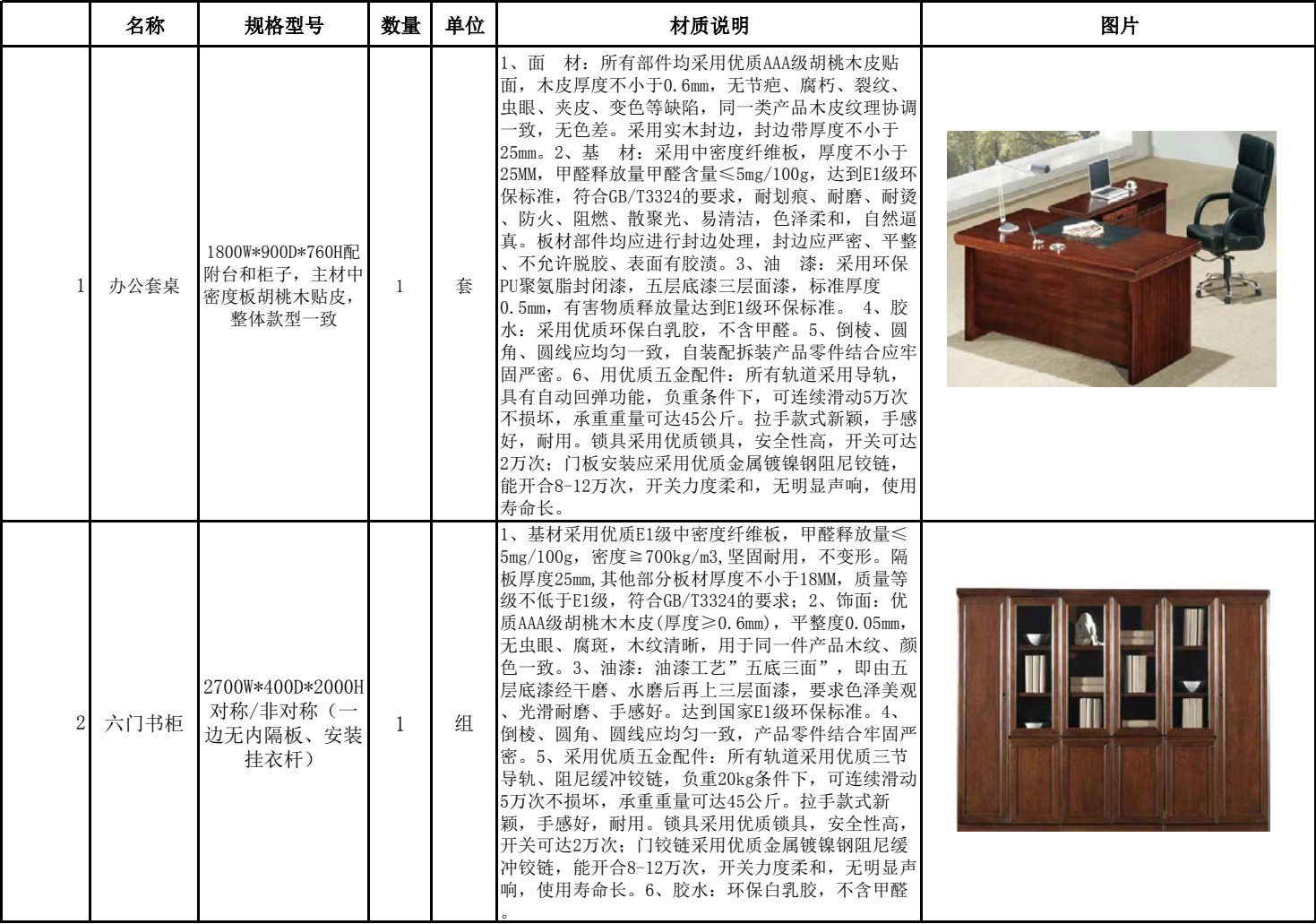
办公家具配置方案及报价（分包一）