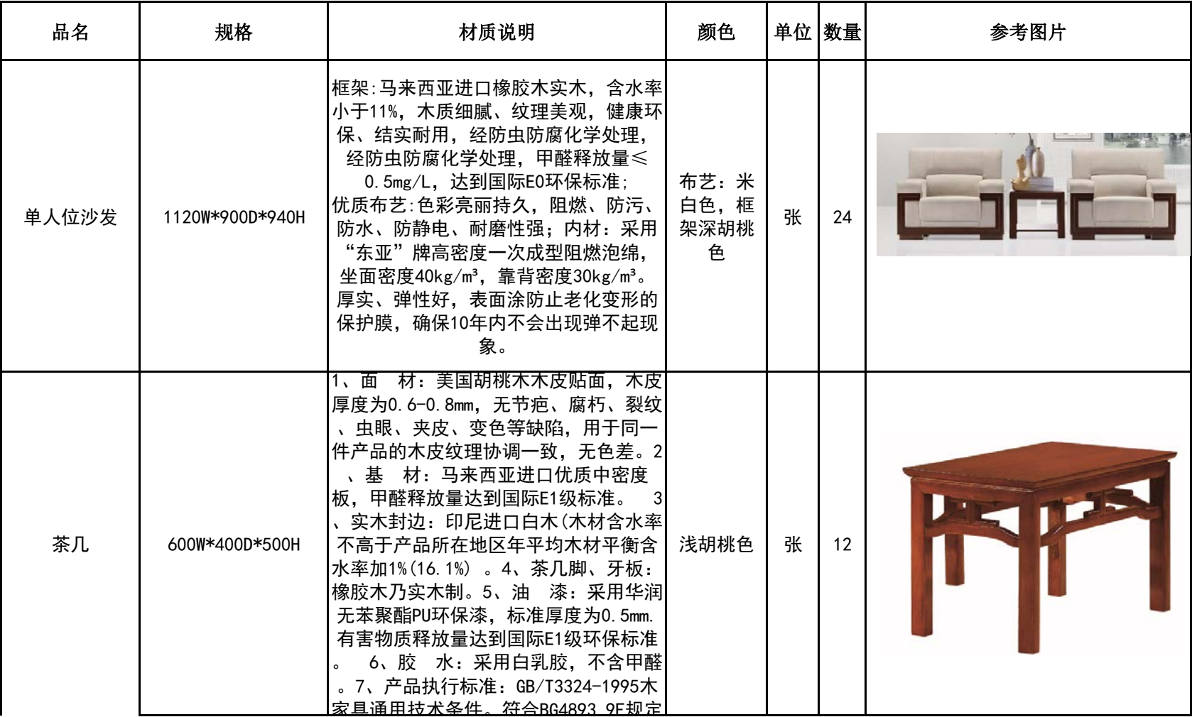
南京中医药大学国教院家具方案清单